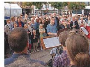
Umringt von einer Zuschaueremenge sang der Haartchor wunderschön mehrstimmig.

in Pepperonis, schaute unverblümt, ironisch und mit moderner Sprache auf das Leben.