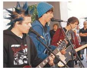
Die Band „The Rush“ spielte mit Punk-Rock die etwas heftigere Gangart.