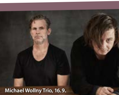
Michael Wollny Trio, 16.9.