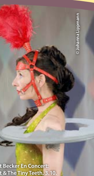
Meret Becker En Concert: Meret & The Tiny Teeth, 3.10.