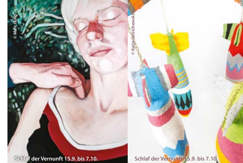
Schlaf der Vernunft 15.9. bis 7.10.

www.marcing.de • www.katja-jaroschewski.de