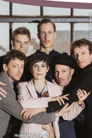
Holler My Dear, 15.9.