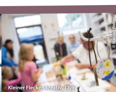
Kleiner Flecken kreativ, 17.9.