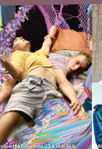
Follow the Dopamine, 23.9. und 30.9.