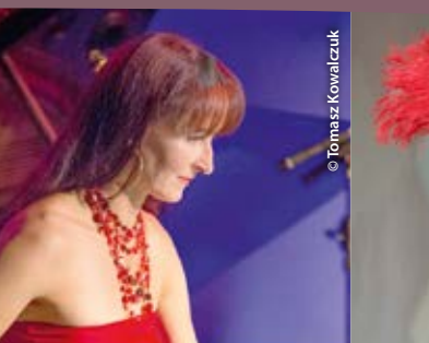
Sisters in Jazz, 30.9.