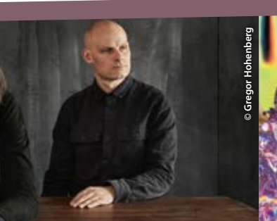
The Maestros, 30.9.