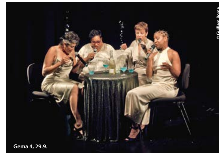
Gema 4, 29.9.

„Wenn du erzählst, erblüht die Wüste“ Eine Königstochter versinkt in tiefe Melancholie. Ein Kaffeehaus-erzähler beschließt, die Prinzessin zu heilen, in dem er allabendlich erzählfreudige Menschen versammelt und sie Geschichten erzählen lässt. Rafik Schami hat mit seinem neuen Buch „Wenn du erzählst, erblüht die Wüste“ eine Hommage an das Erzählen geschaffen. Schami wurde in Damaskus geboren und lebt seit 1971 in Deutschland. Sein Werk wurde mit zahlreichen Preisen ausgezeichnet. Der Autor ist laut FAZ „ein unermüdlicher Brückenbauer zwischen Orient und Okzident“. 20 Uhr, Vicelinkirche Eintritt: 15,- / 12,- ermäßigt Veranstalter: Förderverein Märchen e. V. Veranstaltungsreihe: Der Norden erzählt