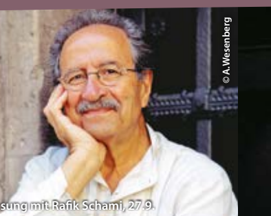
Lesung mit Rafik Schami, 27.9.